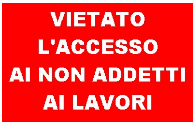
Vietato l'accesso ai non addetti ai lavori